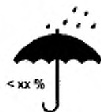
Максимальная влажность для условий хранения