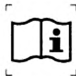
Рисунок 1 — Пиктограммы для спецодежды для защиты от химических веществ

и) пиктограммы по уходу согласно ГОСТ 16958.